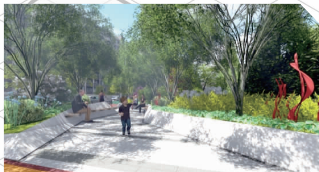
生态盒子(街角微景观)改造后效果图