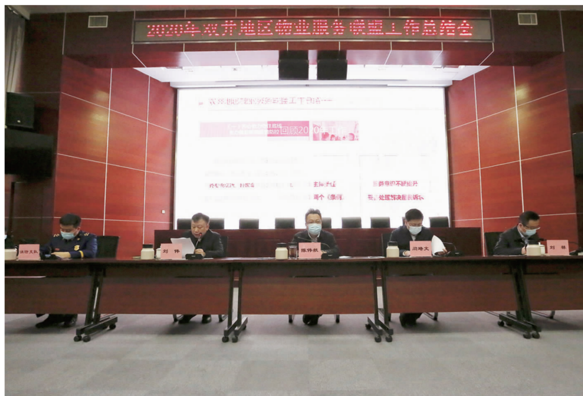
双井街道召开物业服务联盟工作总结会

强垃圾分类宣传倡导,调动居民参与垃圾分类积极性,实现垃圾减量的目标。 物业管理的规范发展任重道远,双井地区将不畏困难、砥砺前行,在改善人居环境、促进社会稳定、推动基层民主建设等工作中不断探索尝试,打造“井井有条”的国际双井品牌。