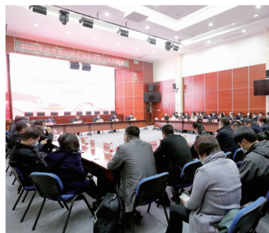
物业服务联盟工作总结会现场