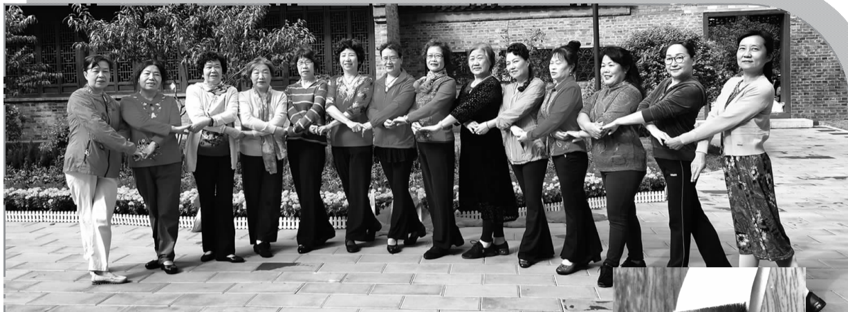
和平村八一舞蹈队 2020 年 9 月建队初期留念