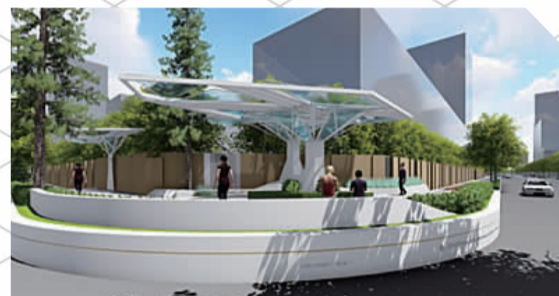
东柏街节点改造效果图