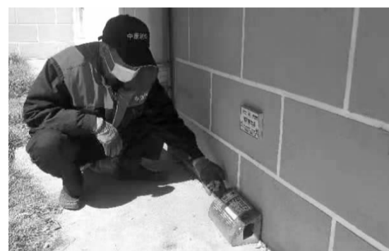
工作人员在辖区内投放老鼠药

随着温度的逐步升高，蚊、蝇、蟑、鼠活动增多，为进一步做好疫情防控，保障双井居民身体健康，3月19日起，双井街道聘请专业第三方消杀公司开展消杀工作。