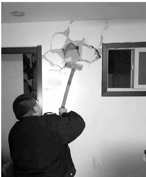
工作人员现场拆除违法隔断

“春节之后外地返京人员增加，租房市场活跃，许多房屋中介为了扩大收益把房屋进行隔断出租。”工作人员说道。在检查过程中发现，某些房屋中介涉嫌违法群租的现象日益增加。在后现代城小区内，中介将一户两居室的房屋打隔断变为六居室。工作人员随即对涉事相关中介进行了现场约谈，对住户进行了现场清退及普法教