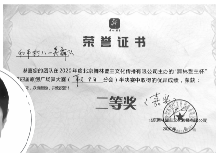
获得的荣誉证书 和平村八一舞蹈队