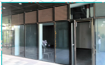
金茂府城市书屋现状