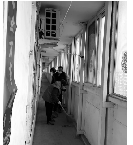
社区工作人员对32号楼进行大扫除